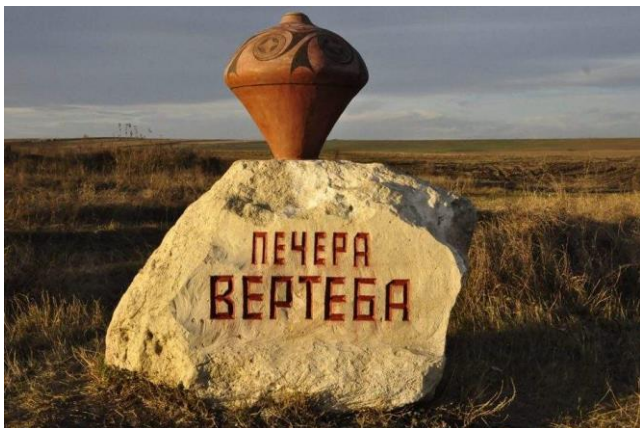
СТОРІНКАМИ РІДНОГО КРАЮ ПЕЧЕРА ВЕРТЕБА

Печера Вертеба розташована поблизу села Більче-Золоте в Тернопільській області, є однією з найцікавіших карстових печер